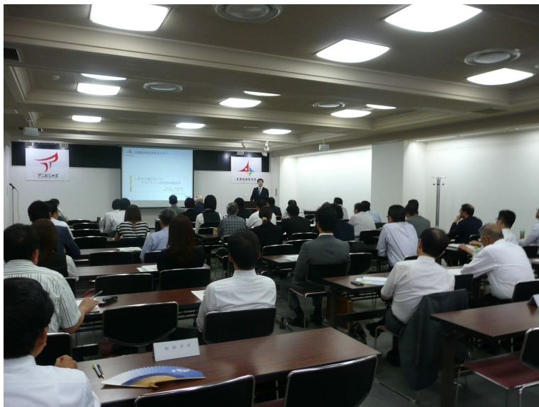
(当日の会場の様子)

このたび、新日本有限責任監査法人と札幌証券取引所との共催により、札幌セミナーを行いました。以下に当日の様子をご紹介します。