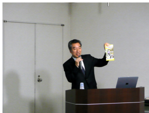
株式や債券の仕組みと特徴など、 幅広い内容を丁寧に 説明していただきました