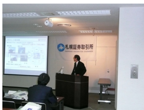
石油だけでなく、さまざまなエネルギーを提供する会社内容を熱心に語られていました