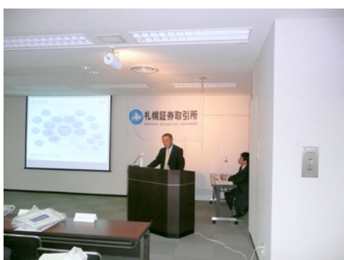
連結対象会社数が626社にも及び 広範囲な事業をわかりやすく 説明されました